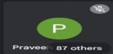
Praveen 87 others